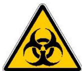
Simbolo rischio biologico

I DPI monouso utilizzati nel corso degli interventi, una volta tolti, devono essere inseriti in un contenitore chiuso (anche un sacco di plastica per i rifiuti) e trasportati presso il centro di lavoro, lì dovranno essere depositati in un apposito contenitore omologato (sono consentite le scatole di cartone omologate 4G) recante la scritta "Rifiuti sanitari pericolosi a rischio infettivo" e il simbolo del rischio biologico. Il contenitore dovrà quindi essere chiuso in attesa del conferimento ad impresa di smaltimento